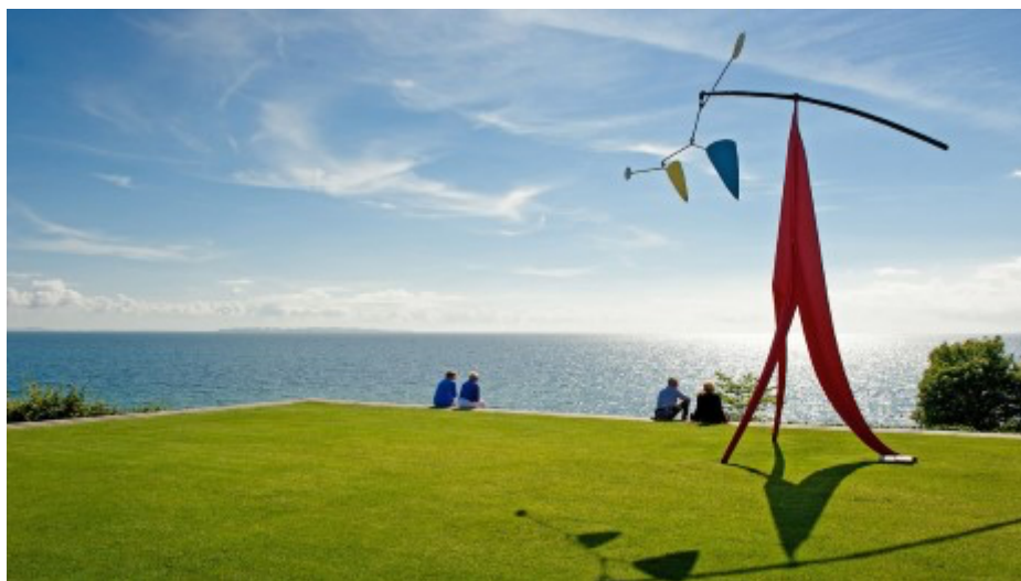
Louisiana museum of modern art

Påmelding skjer direkte til Reiseakademiet på mail: post@reiseakademiet.no eller via våre nettsider www.reiseakademiet.no